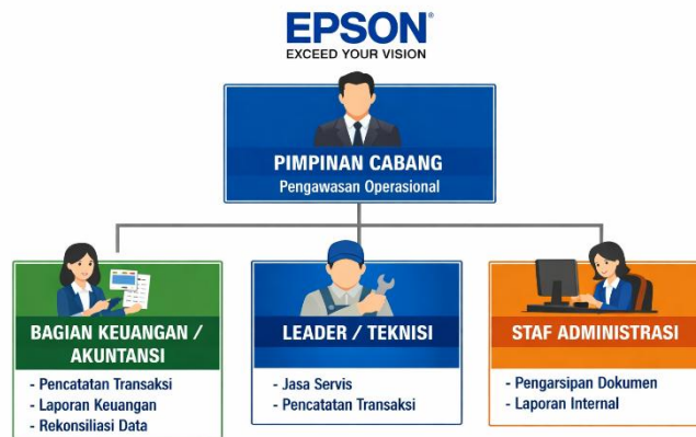
Gambar 4.2 Struktur Organisasi Epson Service Center Kota Palu

dan kontrol inventaris untuk mendukung layanan cepat dan efisien.